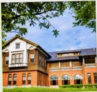
พิพิธภัณฑน์น้ำพุร้อนเป่ย์โถว