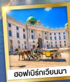
ฮอฟเบิร์กเวียนนา