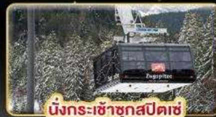
นั่งกระเช้าชุกสปีตซ์