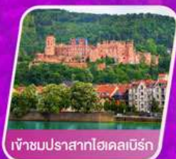
เข้าชมปราสาทไฮเดลเบิร์ก

🏨 โรงแรม 4 ดาว 🍴 อาหาร 14 มื้อ 🚰 โคน้ำ 1 ใบ 🧳 23 กก.