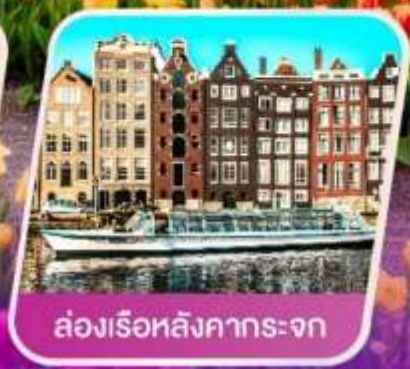
ล่องเรือหลังคากระจุก