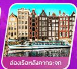
ส่องเรือสิงคารถะจก