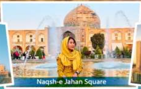
Naqsh-e Jahan Square