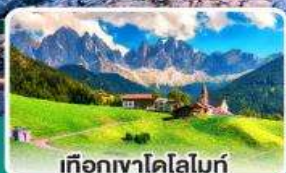
เทือกเขาโดโลไมท์