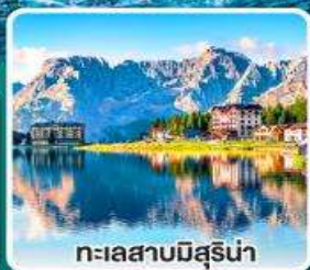
ทะเลสาบมิสุรีน่า

เข้าชมมหาวิหารเซนต์ปีเตอร์ ที่ใหญ่ที่สุดในโลกแห่งนครวาติกัน