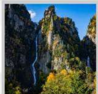
"GINGA & RYUSEI FALLS"

ต้นตอ "ทุ่งดอกพืชมอส ณ สวนดอกชิบะซากุระ-อิงะชิโมะโคะโคะ" ด้วยพรมสีชมพูที่มีพื้นที่ขนาดใหญ่ถึง 100,000 ตารางเมตร ชม "ทะเลสาบคาบสมุทรชิเรโตโก" เกิดมาจากการระเบิดของภูเขาไฟโอเอและน้ำพุใต้ดิน จนเกิดเป็นทะเลสาบทั้ง 5 ของชิเรโตโก "ฟาร์มสุนัขจิ้งจอกฮอกไกโด" ฟาร์มสุนัขจิ้งจอกแห่งเดียวของเกาะฮอกไกโด สายพันธุ์ท้องถิ่นคือ สายพันธุ์ Ezo red fox เพลิดเพลินกับ "เนินสีฤดู" เนินเขากว้างใหญ่ที่มีดอกไม้ไม้บานาพันธุ์นับ 30 ชนิดปลูกเรียงรายสลับสีกันเป็นแนวยาว นำท่าน "นั่งกระเช้าภูเขาคุโรดะเคะ" เชื่อมจากเชิงเขาของเมืองโซอุนเคียวถึงยอดเขาคุโรดะเคะที่มีความสูงถึง 670 เมตร ไฮไลท์ "ส่องเรือราอูสี ชมความงามของวาฬเพชรฆาต" บริเวณคาบสมุทรชิเรโตโก มรดกโลกทางธรรมชาติของฮอกไกโด