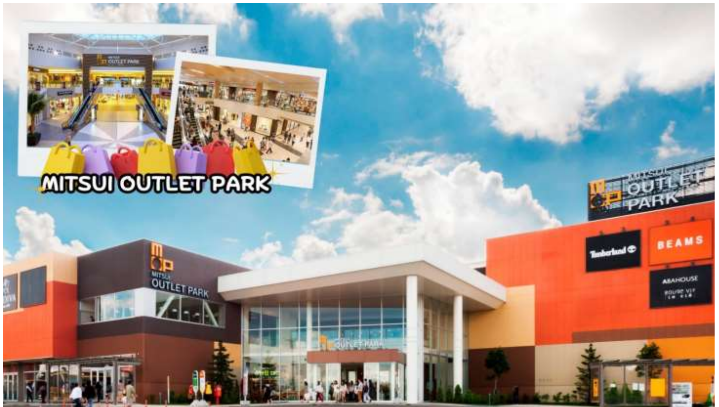
กลางวัน อีสรระอาหารกลางวันตามอัยาศัย ณ MITSUI OUTLET PARK SAPPORO