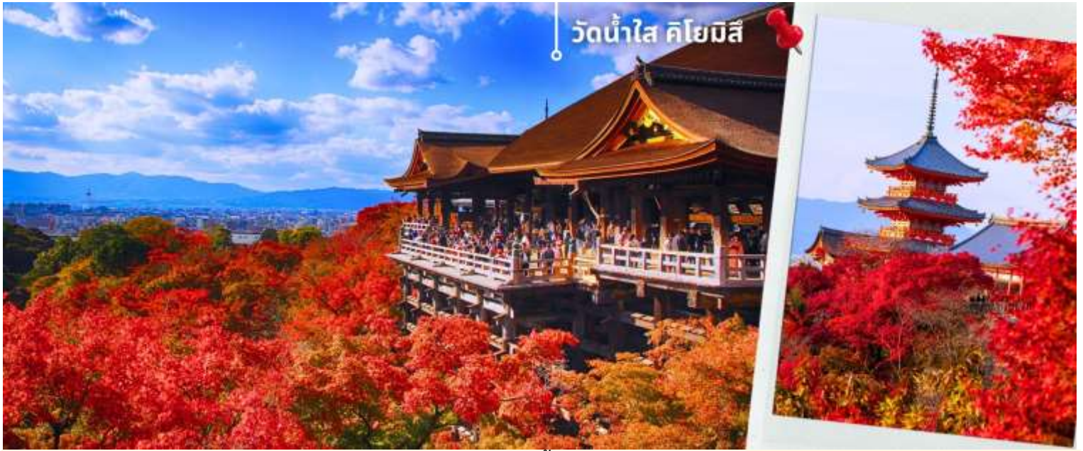
วัดน้ำใส คิโยมิสึ

*ระยะเวลาการเปลี่ยนสีของใบไม้จะขึ้นอยู่กับสายพันธุ์และสภาพอากาศ*