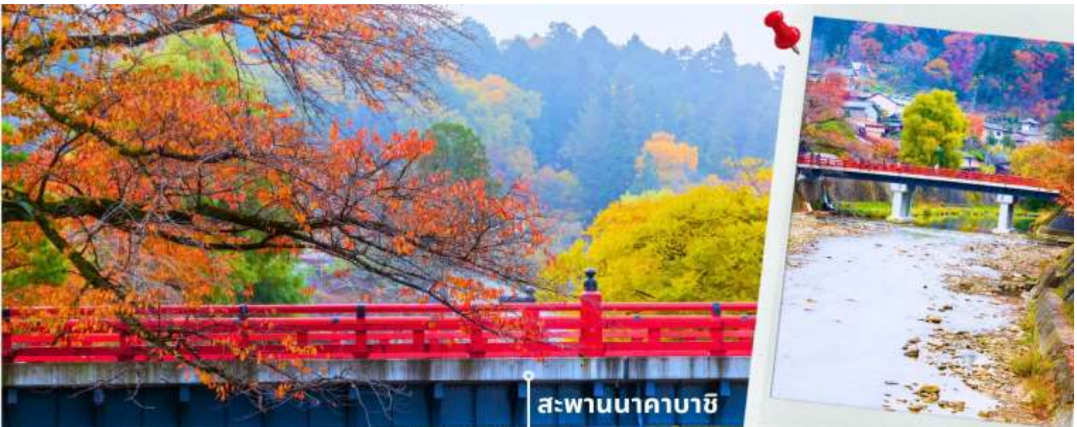
สะพานนาคาบาชิ

จากนั้นนำท่านเดินทางสู่ เมืองทาคายาม่า ซึ่งเป็นเมืองเล็กๆ ที่ตั้งอยู่ในจังหวัดกิฟุ ที่ห้อมล้อมไปด้วยภูเขาและธารน้ำใส พาท่านแวะถ่ายรูปและชมวิวที่ สะพานนาคาบาชิ เป็นสะพานที่สามารถเห็นได้ชัดอย่างโดดเด่นจากสีที่แดงเข้ม อีกทั้งสะพานแห่งนี้ยังถือเป็นสัญลักษณ์ที่สำคัญจุดหนึ่งของเมือง โดยเฉพาะใบไม้เปลี่ยนสีที่จะมีใบไม้สีส้มสดใสสะพรั่งอยู่รายล้อมตัวสะพาน จนกลายเป็นจุดชมวิวยอดนิยมแห่งหนึ่งของเมืองทาคายาม่า