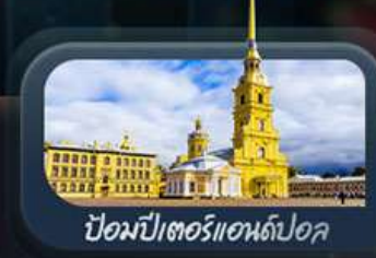
ป้อมปีเตอร์แอนด์ปอล