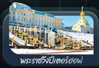
พระราชวังปีเตอร์ฮอฟ