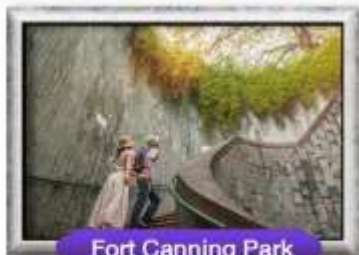
Fort Canning Park