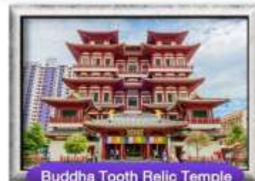
Buddha Tooth Relic Temple