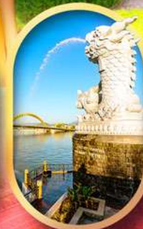
คาร์พดราทอน