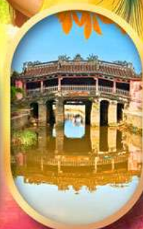
เมืองเก่าฮอยอัน