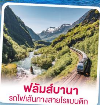
พลัมส์บานา รถไฟเส้นทางสายโรแมนติก