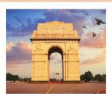
♥♥♥ India Gate