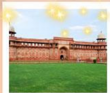
Ajmer Sharif Dargah