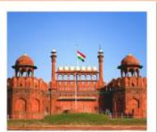
♥♥♥ Agra Fort