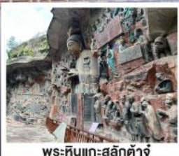
พระหินแกะสลักตำจู้