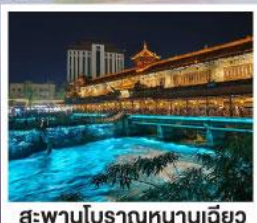
สะพานโบราณหนานเฉียว