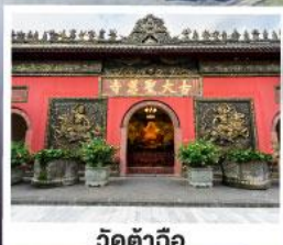
วัดตำฉือ