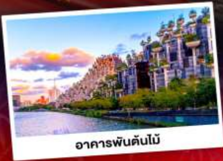
อาคารพันต้นไม้

ชมการแสดงพลุสุดปังที่สวนสนุกดิสนีย์แลนด์