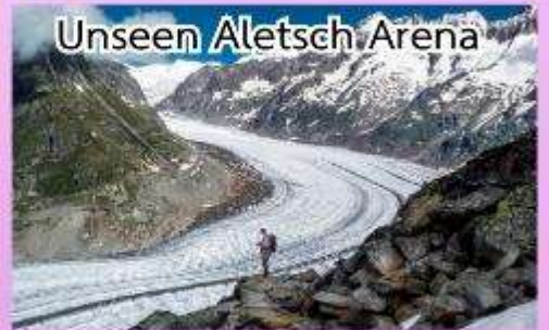
Unseen Aletsch Arena