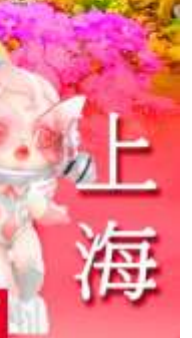
ช้อปปิ้งถนนหนางจิง