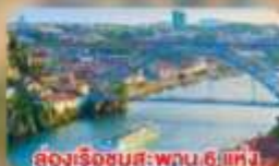
ล่องเรือชมสะพาน 6 แห่ง ในคูร์เมืองปอร์โต