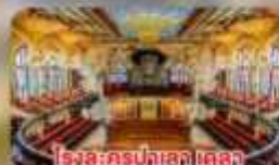
โรงละครบัลเลต์ เดลลา มูสิกกา คาตาลา