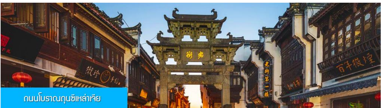
ถนนโบราณถุนซีเหล่าเจีย

หลังอาหารนำท่านเที่ยวชม หมู่บ้านโบราณหงซุน 宏村 หมู่บ้านโบราณจีนชื่ออายุกว่า 800 ปีที่ได้รับการขึ้น ทะเบียนเป็นมรดกโลกทางวัฒนธรรมจาก UNESCO ชมบ้านเรือนโบราณที่ถูกสร้างขึ้นในยุคราชวงศ์หมิง และ ราชวงศ์ชิงที่ยังคงสภาพที่สมบูรณ์กว่า 140 หลัง นำท่านเที่ยวชมตามจุดเช็คอินขึ้นชื่อภายในหมู่บ้าน อาทิ บึงน้ำ พระจันทร์ ทะเลสาบหนานหู โรงเรียนหนานหู หอบรรพบุรุษ คลองน้ำหงซุน ต้นไม้โบราณ ฯลฯ จากนั้นนำท่านเดินทางสู่เมือง หวงซาน (ระยะทาง 70 กม. ใช้เวลาเดินทางราว 1 ชั่วโมง)