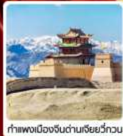
กำแพงเมืองจีนด่านเสี่ยววี่กวน

• ไซโล่...เส้นทางสายไหม ชมสระบัววังพระจันทร์ ทะเลทรายผิงซาซาน กำแพงเมืองจีนด่านสุดท้าย "เจียยวี่กวน" มรดกโลกภูเขาสายรุ้งจางเย่