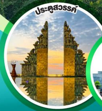
ประตูลสุวรรณค์