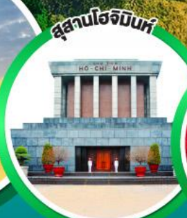
สุสานโฮจิมินห์