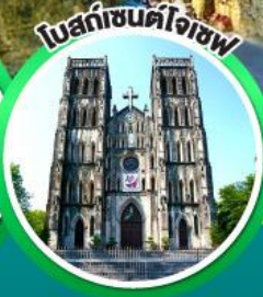
โบสถ์เซ็นต์โจเซฟ