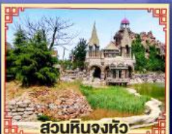
สวนหินงิ้วหวู่