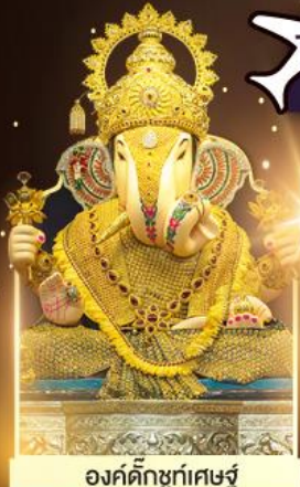
องค์ดีกษุท์เศษฐ์