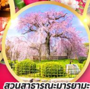
สวนสาธารณะมารุยามะ