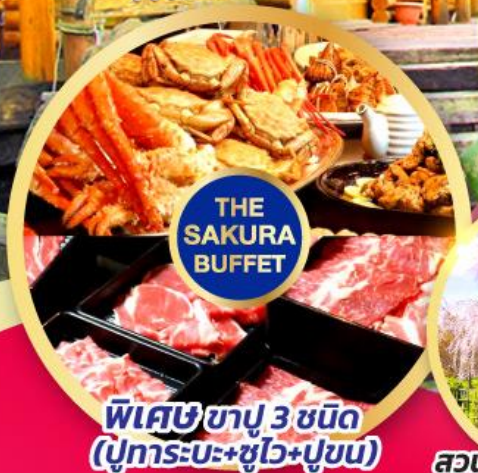
พิเศษข่าปู 3 ชนิด (ปูทะเล+ปูม้า+ปูขนิ)