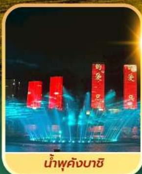
น้ำพุคังบาซี