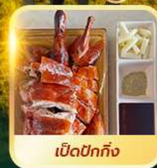
เบ็ดปักกิ้ง