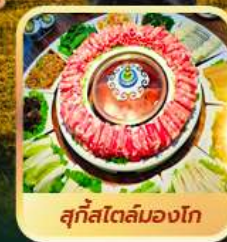
สุกีสโตลมองโก