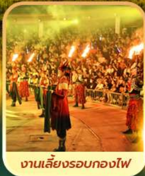
งานเลี้ยงรอบกองไฟ