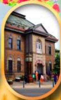
พิพิธภัณฑ์กล่องดนตรี