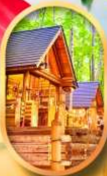
บึงเกิลเกออส