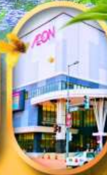
อออนมอลล์