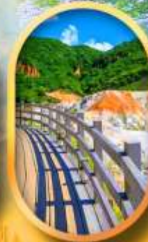
โนโบริเบทส์