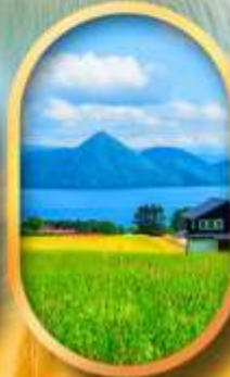
ทะเลสาบโทโยะ