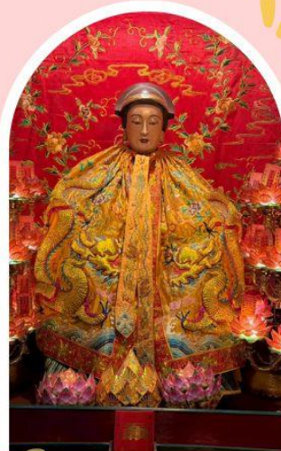
วัดหลงโหมว

ความสำเร็จ ความมั่งคั่ง เงินทองไหลมาเทมา