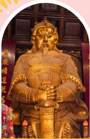
วัดเชกวง