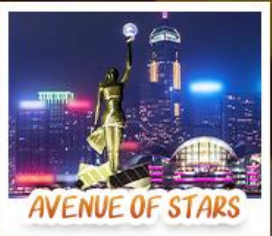
AVENUE OF STARS