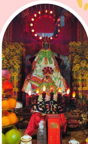
วัดเจ้าแม่กวนอิมฮ่องฮำ

ความสำเร็จ ความมั่งคั่ง เงินทองไหลมาเทมา