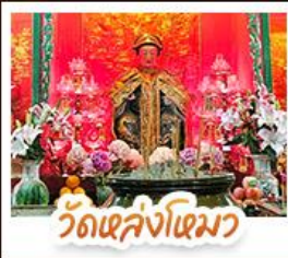
วัดเล่งโงมว

นั่งรถรางพืดแตรมสู่ TOP OF PEAK • ซอปปิงจุใจมงกิก และ CITYGATE OUTLAETS • นั่งกระชานองปิง สักการะพระใหญ่เทียนถาน • จอพรเจ้าแม่หล่งโหมว แม่กอง 5 มิงกร ให้ประสบความสำเร็จในทุกๆ ด้าน