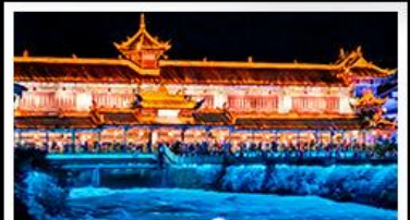
สะพานหนานเฉียว BLUE TEARS

สวนเม่านงวา - อุทยานหลุมฟ้าสะพานสวรรค์ สีดรุณี - หงหยาดัง - รถไฟฟ้าทะเลสาบ สะพานหนานเฉียว BLUE TEARS พักโรงแรมระดับ 4 ดาว - ไม่ลงร้านช้อปปิ้ง เมนูพิเศษ สุกี้หม่าล่า เปิดปิกนิก