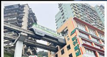
รถไฟฟ้าทะเลสาบ