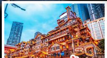
แดงหยาดัง