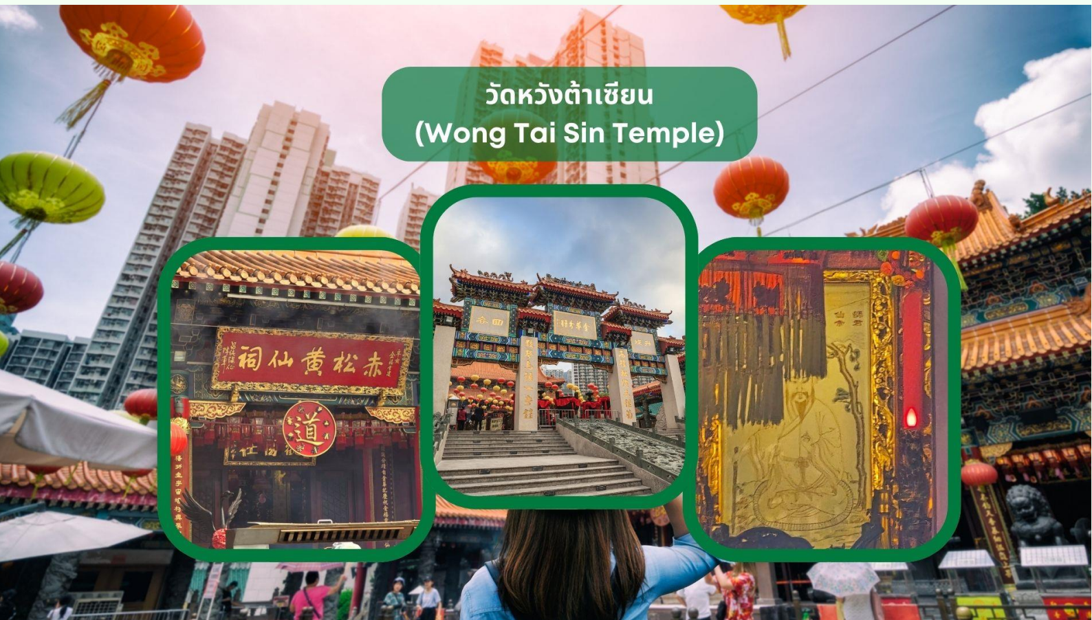
วัดหวังต้าเซียน (Wong Tai Sin Temple)

รับประทานอาหารเช้า ณ ภัตตาคาร บริการท่านด้วยเมนูติ่มซำฮ่องกง (มื้อที่ 3)