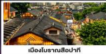
เมืองโบราณสี่ปาที้