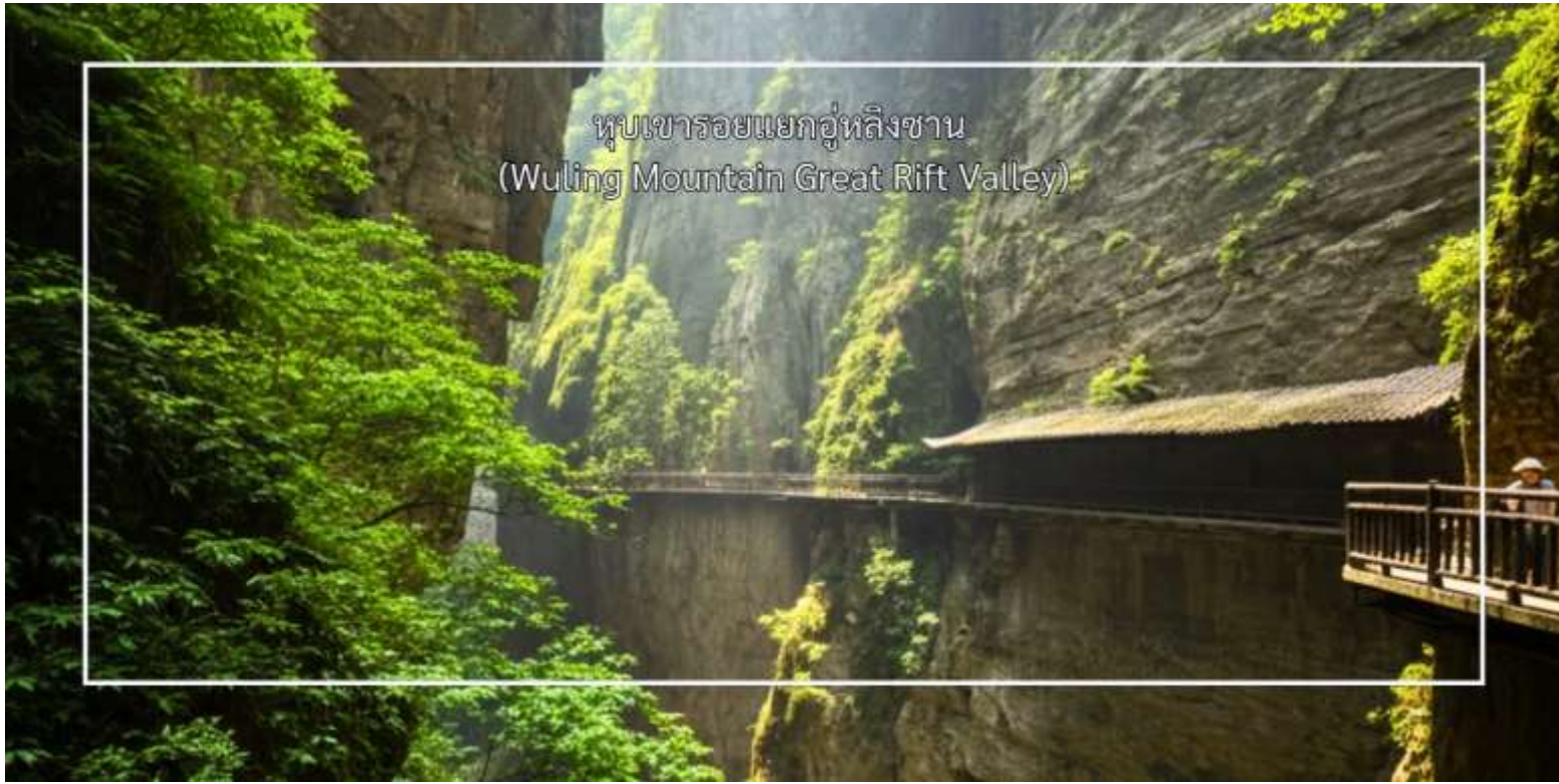
หุบเขารอยแยกอู่หลิงซาน (Wuling Mountain Great Rift Valley)

แวะถ่ายภาพ ฐานวิศวกรรมนิวเคลียร์ 816 (816 Nuclear Engineering Base) โครงการลับสุดยอดของจีนในยุคสงครามเย็น เป็นฐานใต้ดินขนาดมหึมาที่เจาะลึกเข้าไปในภูเขาใช้เวลาสร้าง 17 ปี แรงงานทหารกว่า 60,000 นาย มีอุโมงค์ยาวกว่า 20 กิโลเมตร ภายในมีห้องโถงที่ใหญ่ที่สุดสูงเท่าตึก 20 ชั้น หลังจากการยกเลิกโครงการ ฐานแห่งนี้ก็ถูกปิดเป็นความลับนานหลายปี ก่อนที่จะได้รับการปลดความลับในปี 2002 และเปิดให้เป็นแหล่งท่องเที่ยวในปี 2010 ซึ่งไม่มีสารกัมมันตรังสี และเปิดให้เข้าชมความอลังการของวิศวกรรมการก่อสร้างใต้ดิน ที่ไม่เคยถูกใช้งานจริง สมควรแก่เวลานำท่านเดินทางกลับ ฉงชิ่ง (ใช้เวลาประมาณ 2.30 ชั่วโมง)