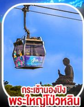
กระเช้าเองปีง พระใหญ่โป่วหลิน