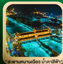
“สะพานหนานเฉียว น้ำคาสีฟ้า”