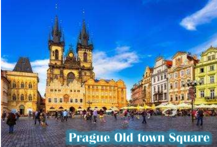
Prague Old town Square