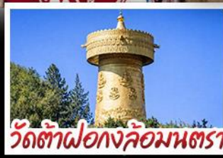
วัดต้าฝอ กงล้อมณฑล