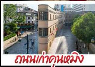
ถนนเก่าคุณหมิง