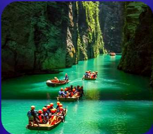
“ ผิงซานแกรนด์แคนยอน ”

เที่ยวจีน 2 มณฑล เสฉวน+หูเป่ย์ • ถ้าถึงหลง • ทูบเวาสิงโต ซื่อจื่อกวน ล่องเรือมังกรกังสุ่ยชมวิวยามค่ำคืน • ผิงซานแกรนด์แคนยอน (รวมล่องเรือ) หงหยาดัง • จุดชมรถไฟฟ้าทะลุทิว • ตึกตะเกียบ • สือปาตี • หลงเหมินฮ่าว