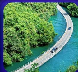
“ ทูบเวาสิงโต ซื่อจื่อกวน ”