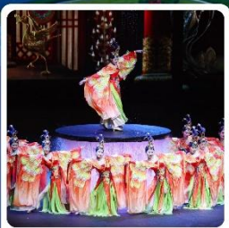
โชว์ FOSHAN QIANGQING