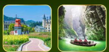
สวน Alice's Garden ล่องเรือแม่น้ำไตติงกุฮิว