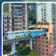
รถไฟฟ้า-ลุดัก