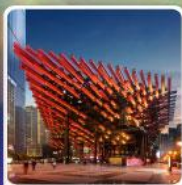
พิพิธภัณฑ์ศิลปะ-ตะเกียบ