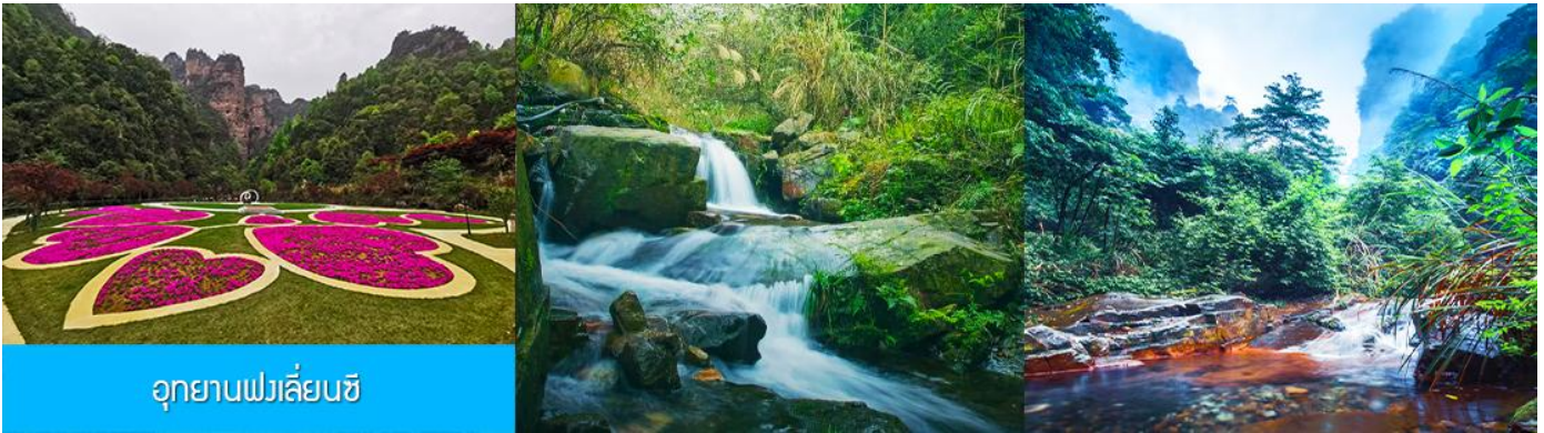
อุทยานฟงเลียนซี