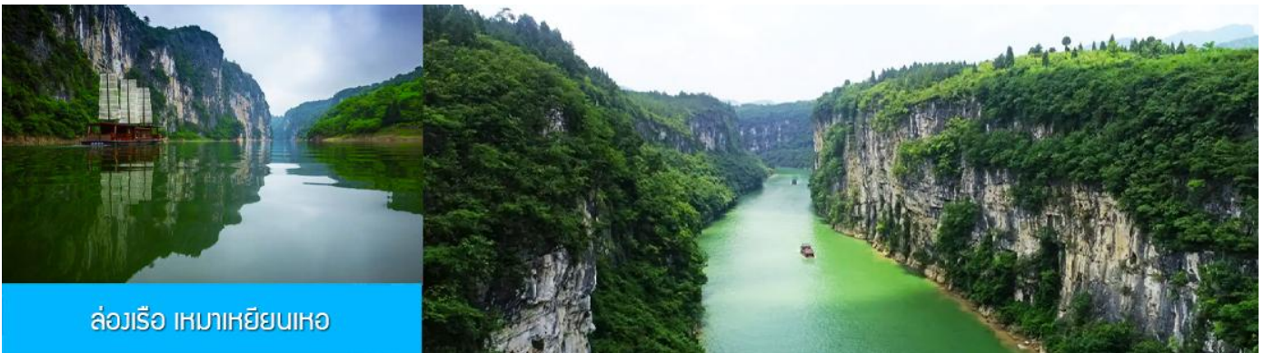
ล่องเรือ เหมาเหยียนเหอ