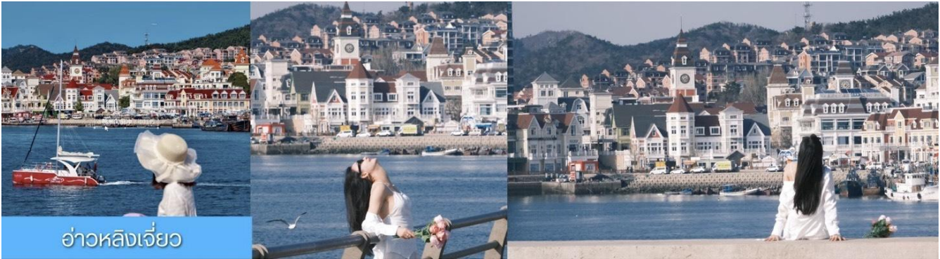
อ่าวหลังเจี๊ว