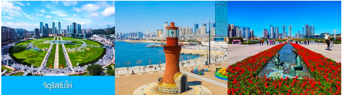
จัตุรัส星海

หลังอาหารนำท่านเที่ยวชมและเก็บภาพ ณ ถนนรัสเซีย 俄罗斯风情街 ในอดีตที่นี่เป็นที่ตั้งของที่ศาลาว่าการเมืองต้าเหลียน ภายหลังได้กลายเป็นชุมชนของพ่อค้าและวิศวกรทางรถไฟชาวรัสเซีย บริเวณนี้จึงเต็มไปด้วยอาคารบ้านเรือนแบบตะวันตก (รัสเซีย) มากมาย นอกจากนี้ได้เก็บภาพที่มีพื้นหลังเป็นอาคารสถาปัตยกรรมตะวันตก ที่นี่ยังมีร้านค้าที่จำหน่ายสินค้าและของที่ระลึกที่นำเข้าจากรัสเซีย อาทิ ช็อกโกแลต เหล้าวอดก้า ตุ๊กตารัสเซีย ฯลฯ