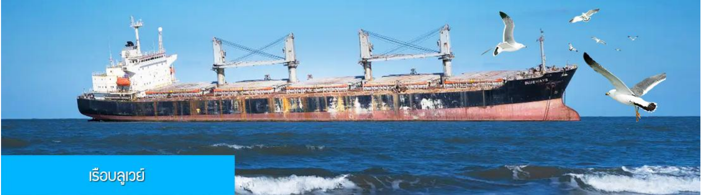
เรือบลูเวย์