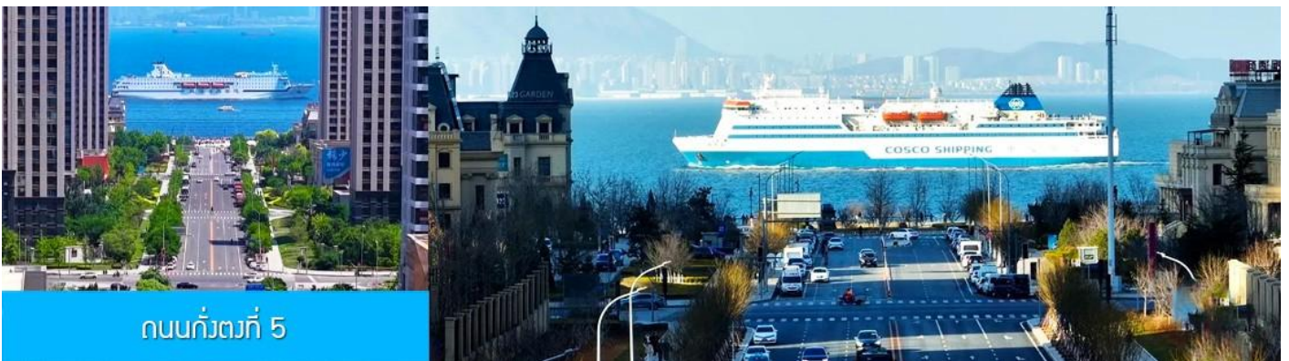
ถนนกั๋วตงที่ 5

นำท่านเที่ยวชม จัตุรัส星海 星海广场 เป็นจัตุรัสขนาดใหญ่เป็นแลนด์มาร์คสำคัญของเมืองต้าเหลียน สร้างขึ้นเพื่อเฉลิมฉลองในโอกาสที่รัฐบาลอังกฤษคืนเกาะฮ่องกงในให้จีนในปี ค.ศ. 1997 ตั้งอยู่ชายฝั่งทะเลในเมืองต้าเหลียน เป็นจัตุรัสใจกลางเมืองที่ใหญ่ที่สุดในโลกและ เป็นแลนด์มาร์คของเมืองต้าเหลียน รายล้อมด้วยตึกระฟ้าที่ทันสมัย ภายในมีบ่อน้ำพุดนตรี ลานหญ้าขนาดใหญ่ และลานกว้างสำหรับจัดกิจกรรมกลางแจ้ง อาทิ เทศกาลเบียร์นานาชาติ การแข่งขันวิ่งมาราธอน งานแฟชั่นนานาชาติเมืองต้าเหลียน ฯลฯ