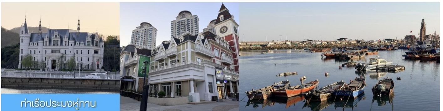
ท่าเรือประมงหู่ทาน

หลังอาหารเช้า นำท่าน เที่ยวชม ท่าเรือประมงหู่ทาน 大连渔人码头 เป็นจุดเช็คอินที่โดดเด่นด้วยสถาปัตยกรรมสไตล์ยุโรปสีสันสดใส ผสมผสานกลิ่นอายเมืองท่าดั้งเดิมเข้ากับบรรยากาศสุดโรแมนติกที่เต็มไปด้วยเรือประมงคาเฟ่ ร้านอาหาร และจุดชมวิวยามทะเล