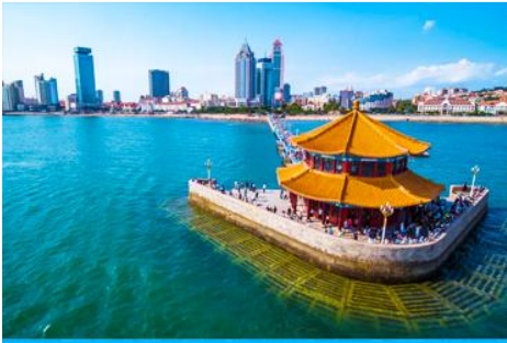
สะพานเจี้ยนเจียว