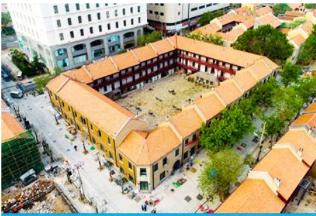
เมืองเก่าเยอรมัน ตรอกกว่างซิงหลี่