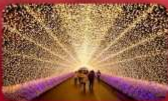
นาบานาโนะซาโตะ