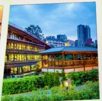
ห้องสมุดเป่ย์โถว