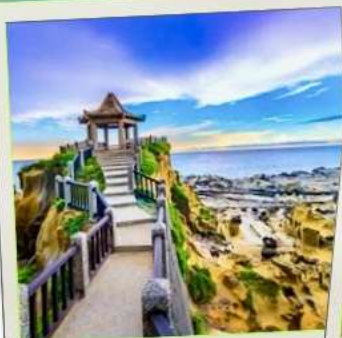
อุทยานเกาะเหอผิง