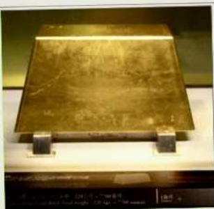
พิพิธภัณฑ์ทองคำ