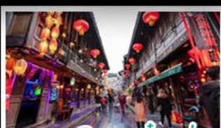
ถนนโบราณจิ่นหลี่