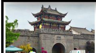
เมืองโบราณกวนเซี่ยน

ภูเขาสดุดี - อุทยานป่ฝิงโกว - สะพานหนานเฉียว - ร้านหนังสือจงซูเก้อ - เมืองโบราณกวนเสียน จตุรัสหย่าเทียนหวู่ - หมีแพนด้าเซลฟี - ถนนโบราณซอหยวงซวยแคบ - ถนนคนเดินไท่กู่หลี่ ถนนคนเดินซุนซี - ถนนโบราณจิ่นหลี่ - แพนด้ายักษ์ปิงตึก - น้ำพุไม้ไผ่ตึกSKP - วัดต้าเฉียว