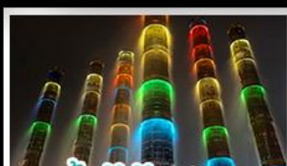
น้ำพุไม้ไผ่ตึกSKP