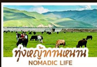
ทุ่งหญ้ากานหนาน NOMADIC LIFE