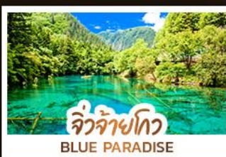
จิวจ้ายโกว BLUE PARADISE