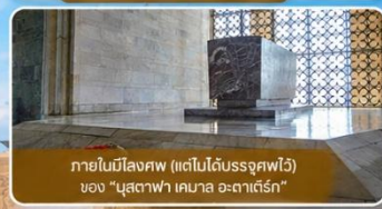
ภายในมีสิ่งศพ (แต่ไม่ได้นำบรรจุศพไว้) ของ "มุสตาฟา เคมาล อะตาเติร์ก"