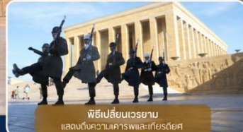
พิธีเปลี่ยนเวรยาม แสดงให้เห็นเคารพและเกียรติยศ