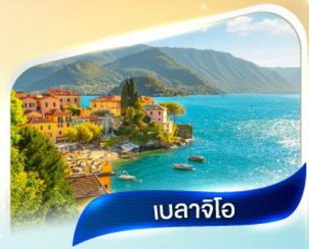
เบลาจีโอ