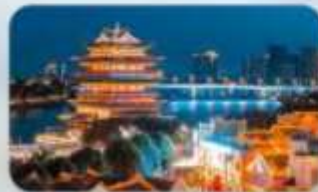
ถนนสามสายสองตอรอก